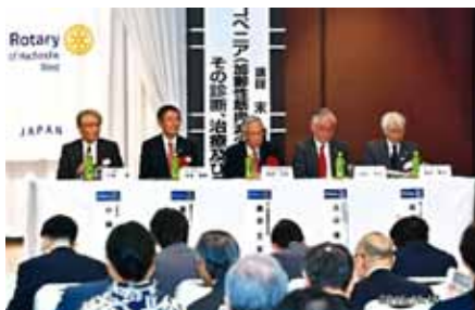
RI 加盟認証状伝達式で来賓

八戸西ロータリークラブはまだまだ未熟なクラブですので、どうか RI 第 2830 地区のロータリアンの皆様、今後ともよろしくご指導下さいませ、そして温かく見守って頂けます様お願い申し上げます。