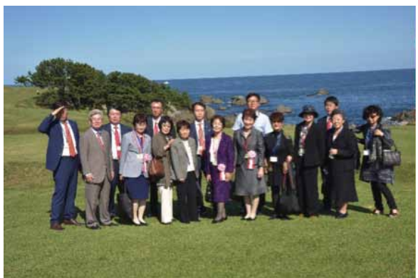
エクスカーシンの思い出