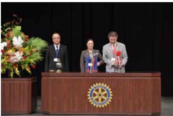
ガバナーが佐々木エレクト、今井ノミニー紹介