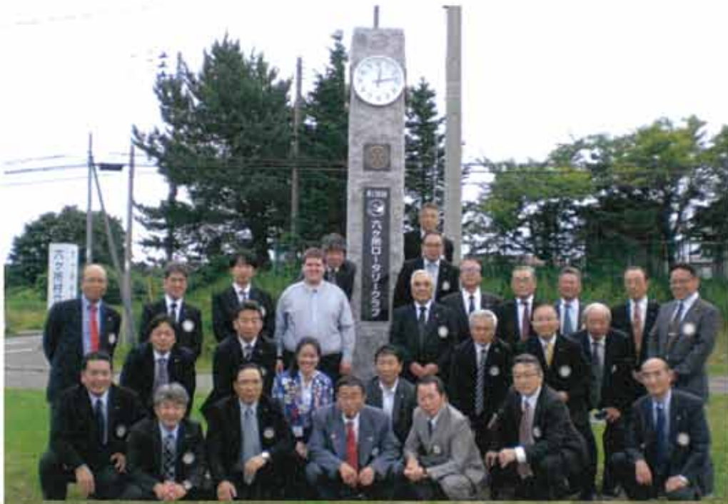
ロータリー20周年記念時計台 除幕式 2016年7月30日(土)

最後になりますが、この事業に関しましてご支援ご協力を承りました六ヶ所村をはじめとする関係者の皆様に心より厚くお礼を申し上げます。