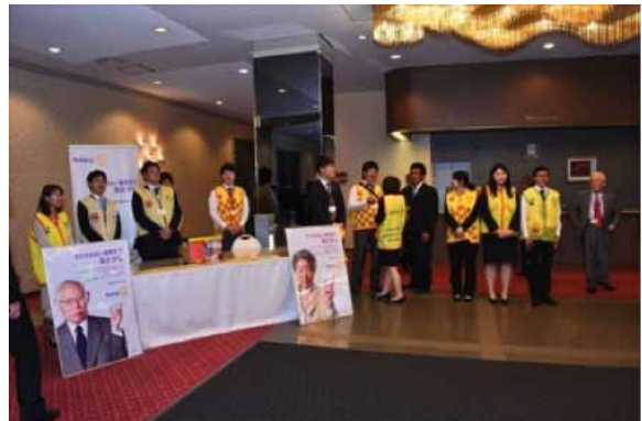
懇親会会場前で RA がポリオ募金運動