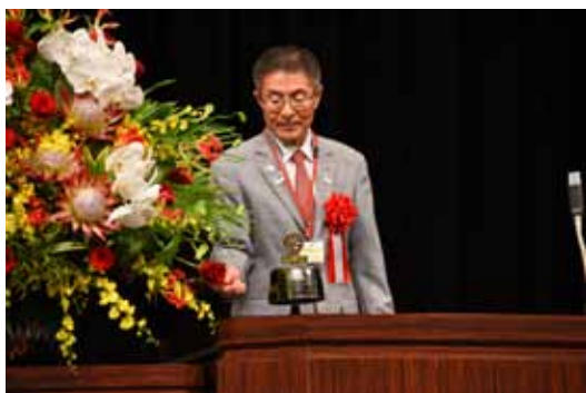
ガバナー点鐘で地区大会が始まる