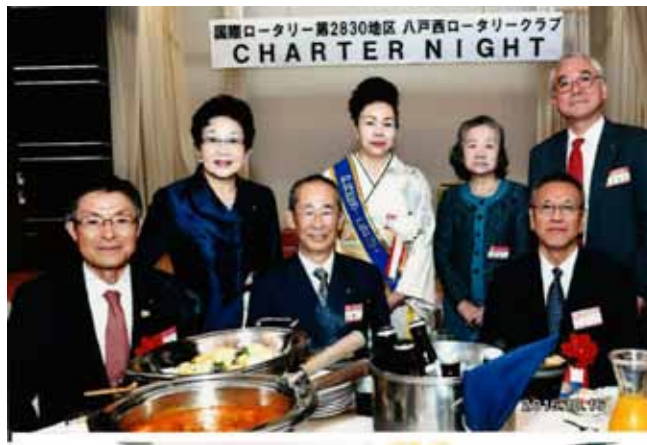
懇親会でガバナーとご来賓