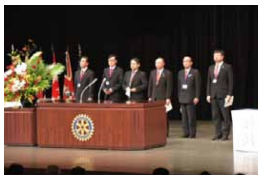
ガバナー補佐が各クラブを紹介