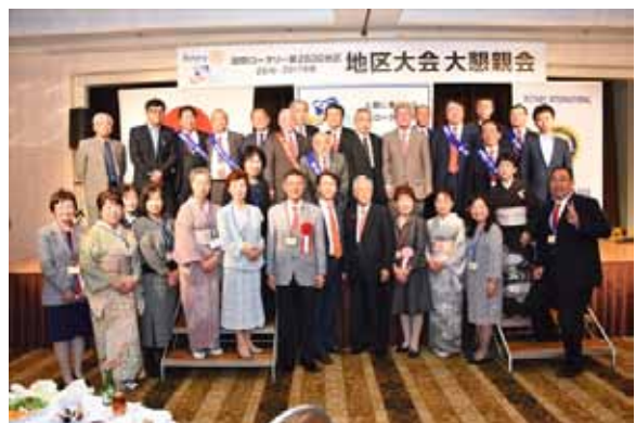
ホスト八戸南 RC の皆様「おつかれさま」