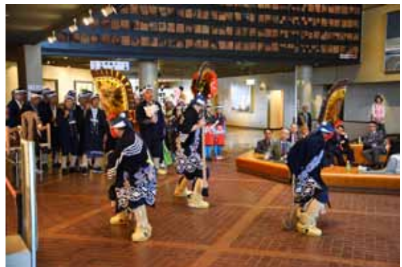
広場での「えんぶり」