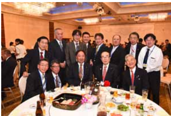
あちこちのテーブルで和気藹々と盃が重ねられそして記念撮影