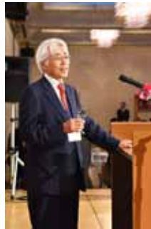
鈴木直前ガバナーの乾杯の発声で声高らかに乾杯！