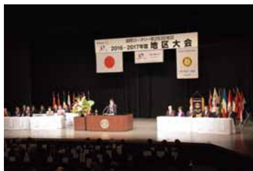
実行委員長の挨拶