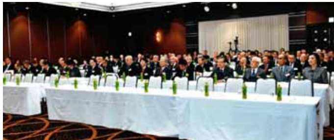
式典会場のロータリアン