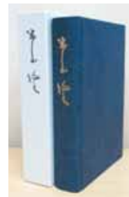
A5判 上製本ケース付 本文590ページ／4,000円