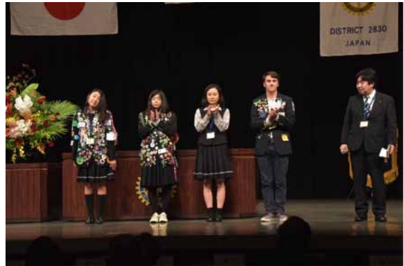
ゲスト紹介・青少年交換