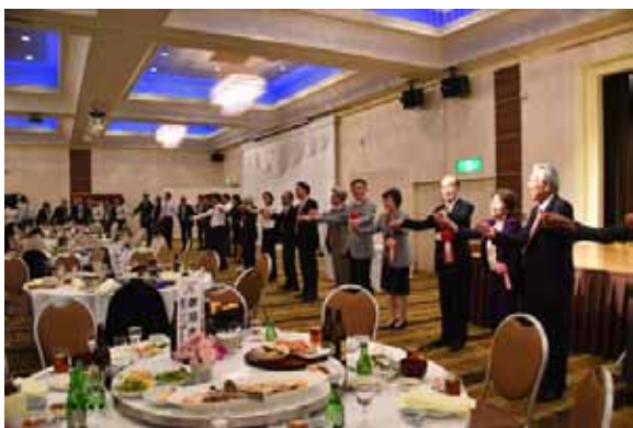
「てにてつないで」がいつもの締め